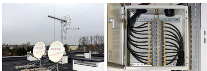
Fot. 1. Elementy instalacji teletechnicznej na osiedlu Sklepowa 22: a) pole antenowe, b) ograniczniki przepięć

Instalacja zawiera profesjonalne pole antenowe składające się z dwóch profesjonalnych anten satelitarnych 1,2 m oraz zespołu anten naziemnych wraz z ochroną odgromową i profesjonalnymi ogranicznikami przepięć zabezpieczającymi przed skutkami wyładowań atmosferycznych.