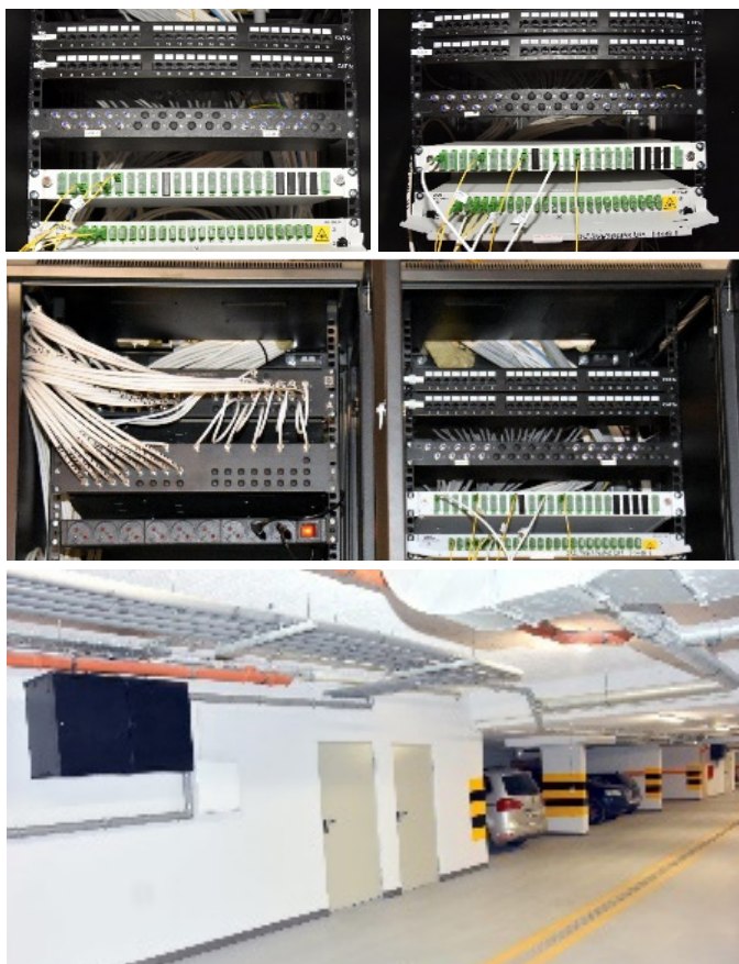
Fot. 2. Punkty styku zainstalowane w garażach na osiedlu Sklepowa 22.

z całego świata. Dostęp do bogatej oferty polskich kanałów TV możliwy jest za pośrednictwem operatorów płatnej TV w Polsce: CANAL+, Cyfrowego Polsatu, UPC, Orange... Oznacza to, że polskie platformy satelitarne mają taką samą możliwość dotarcia z własnymi ofertami programowymi do mieszkańców tych budynków jak inni operatorzy telekomunikacyjni, a mieszkańcy zyskują możliwość szerszego wyboru pomiędzy tymi ofertami.