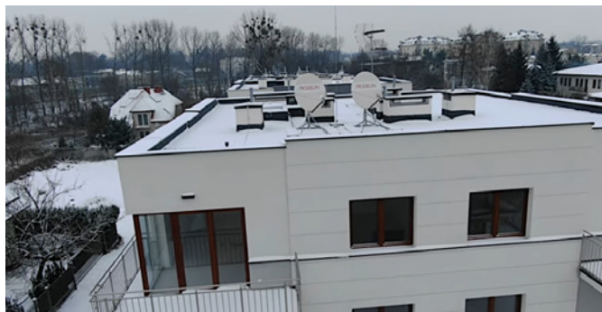
Fot. 3. Pole antenowe na budynku w osiedlu Sklepowa 22 (kliknij, by obejrzeć film!)

naną w wysokim standardzie instalację teletechniczną. Jak podano, zgłoszony kompleks budynków został wyposażony w nadmiarową instalację teletechniczną, umożliwiającą świadczenie usług przez czterech różnych operatorów.